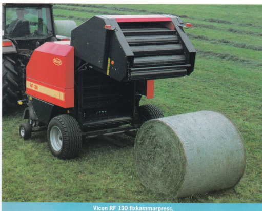
Vicon RF 130 fixkamarpress.

Vicons patenterade INTEGRAL™-system ger en jämn inmatning av materialet över hela arbetsbredden.