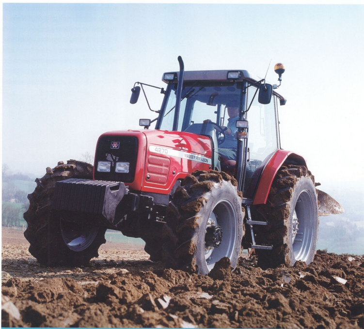
Låg vikt, lite pengar, mycket traktor – MF 4270.

NU ÄR ÅRETS CHANS att köpa starka, smidiga och sexcylindriga MF 4270. Med 110 hk DIN och en tjänstevikt på 4500 kg är det ett verkligt krutpaket du kan få hem till gården. Den låga egenvikten till trots lyfter trepunktslyften 5 ton och framtill finns möjlighet att montera en redskapslyft som tar 2,2 ton. Du får också marknadens kraftfullaste hydraulsystem med 68 minutliter och hela 210 bars arbetstryck. Den rymliga, om-