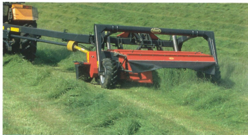
Vicon KMT 3000 CP – slår till höger och vänster.

TRE STARKA SKÄL att välja VICON KMT 3000 CP slåtterkross: centrummonterat drag ger valfrihet i slaget med tre meters arbetsbredd åt höger eller vänster. Vicons rotorbalk med tre knivar på varje tallrik ger knivskarp snitt och hög driftsäkerhet. Vicon konditioneringsystem möjliggör snabbare upptorkning.