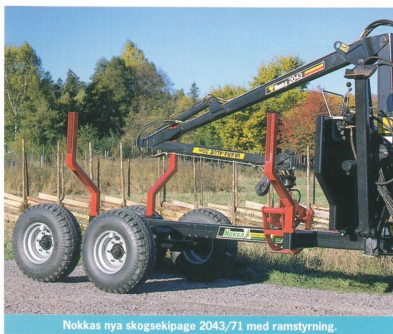
Nokkas nya skogsekipage 2043/71 med ramstyrning.

NU KAN DU KÖPA det du önskar: en smidig skogsvagn med ramstyrning och en rejäl däcksutrustning – välj mellan 11,5/80-5,3 som ger en spårvidd på endast 147 cm och de bredare 400/60-15,5 däck. Den stabila centralramen erbjuder en lastförmåga på hela 7.000 kg och en lastarea på 1,3 m 2 . Två par stöttor och grind är standard. Den smidiga trepunktsmonterade kranen med 4,3 m räckvidd och ett bruttoliftnmoment på 19 kNm ger dig kraft och arbetsglädje. En vridvinkel på 400° ger dig ett stort svängrum, som tillsammans med ett vridmoment på hela 6 kNm gör att du klarar motluten lätt. De hydrauliska stödbenen ger stor stabilitet vid lastning och lossning av virke. ■