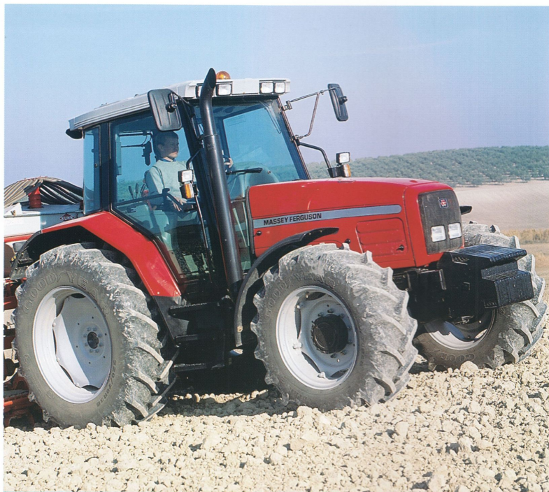
Sexcylindriga 6200-serien sätter en ny standard med 6290 i spetsen.

FÅ TRAKTORER – om ens någon – i 130-140 hk klassen kan mäta sig med MF 6290 när det gäller arbetsförmåga, lyftkapacitet, komfort, utrustning och servicevänlighet. Den nyutvecklade Perkinsmotorn med FASTRAM förbränning ger full effekt och lite till över ett brett varvtalsregister. Lägg därtill den nya DYNASHIFT PLUS-växellådan med 32 växlar och PCS-reglaget, som har koppling, snabbväxlar och fram/