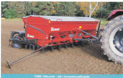
TUME Vältcombi – här i fyrametersutförande.

Köp nu och var beredd till våren med nya vältcombi-maskinen från TUME! Pris: från 139.000:-