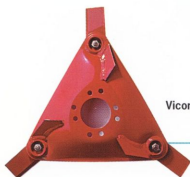
Vicons unika rotortallrik med tre knivar.

Köp nu och var beredd till våren med nya vältcombi-maskinen från TUME! Pris: från 139.000:-